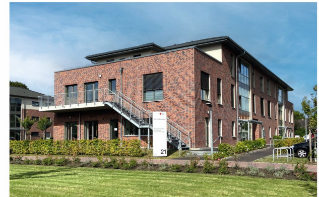
Das Haus am Rosenkamp in Rellingen: Begegnungsstätte, Seniorenberatung und Tagespflege